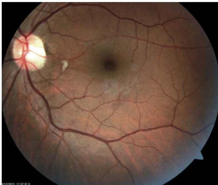
Fotografía 2: Polo posterior del fondo de ojo izquierdo que evidencia un pequeño exudado blanquecino peripapilar temporal.