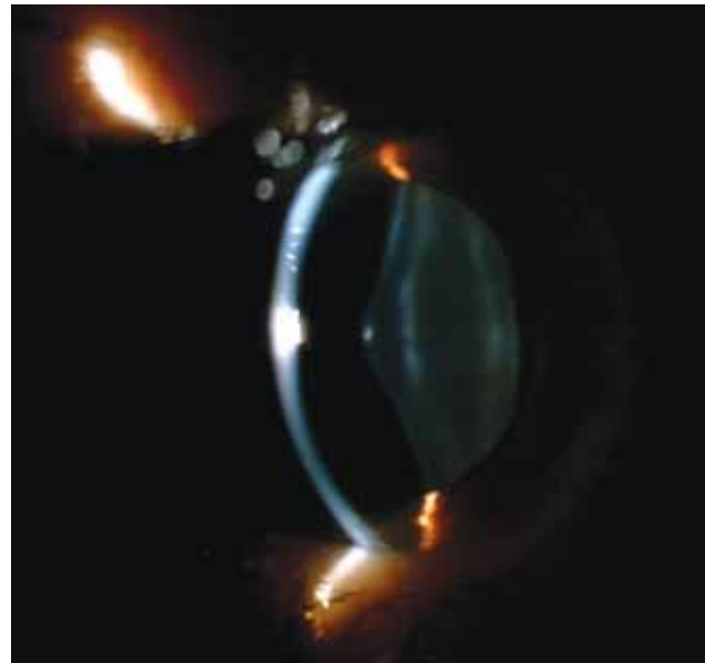
Fotografía 2. Lenticono anterior en lámpara de hendidura. Deformidad cortical del cristalino con aumento del diámetro AP.